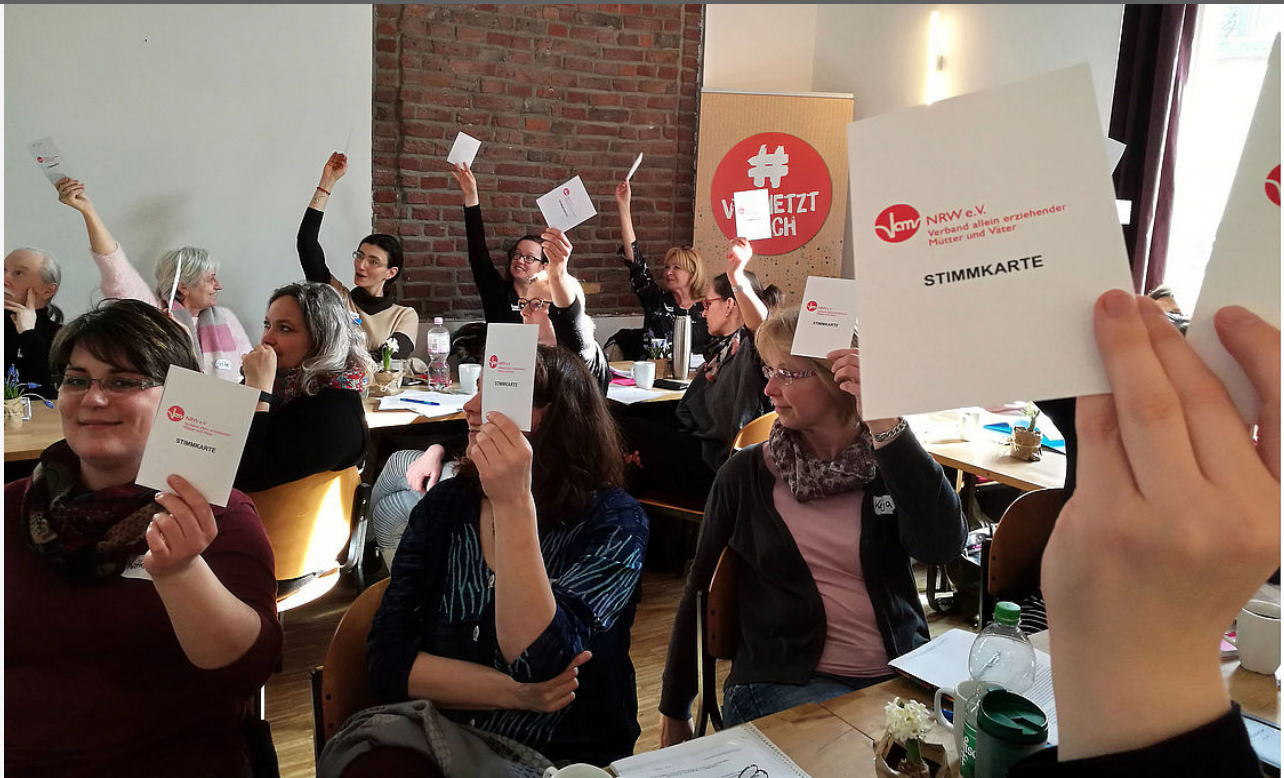
VAMV Netzwerke in NRW